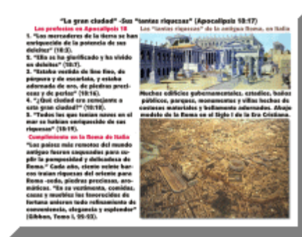
Imagen: riquezas de la Roma imperial en la península itálica.

- "La gran ciudad" -Sus "tantas riquezas" (Apocalipsis 18:17). Las riquezas de la antigua Roma, en Italia.