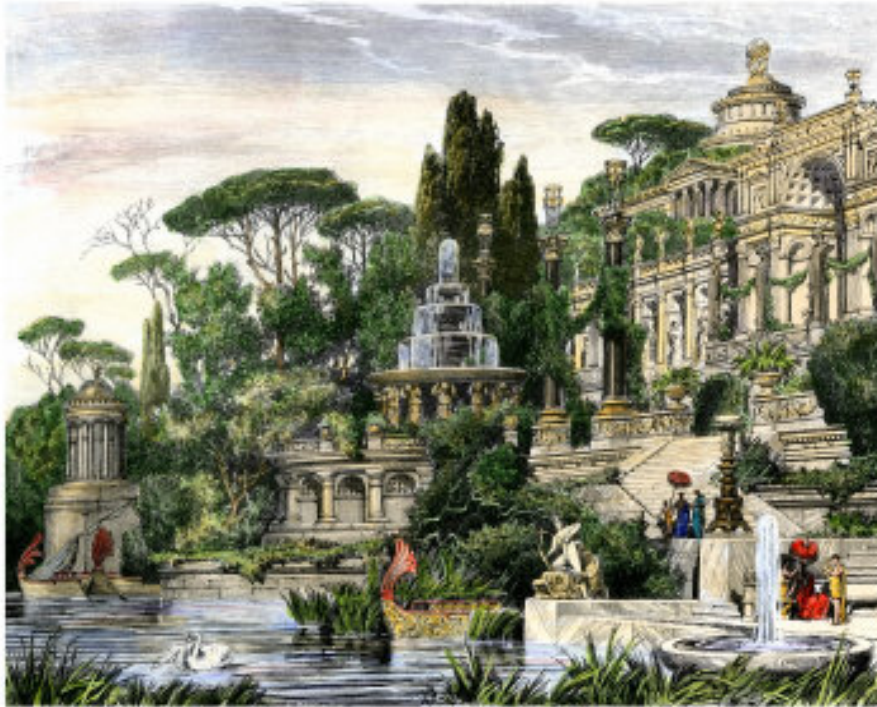
Villa privada de una familia romana rica.

2. “Aurelio protestó que una libra de seda fue vendida en Roma por doce onzas de oro; pero el suministro incrementó con la demanda, y el precio bajo a la par con el suministro” (El decaimiento y caída del Imperio Romano, por Edward Gibbon. Tomo I. Página 656).