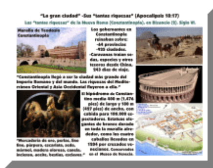
Imagen: riquezas de la Nueva Roma-Constantinopla

- “La gran ciudad” -Sus “tantas riquezas” (Apocalipsis 18:17). Las riquezas de la Nueva Roma (Constantinopla), en Bizancio. (2) Siglo VI. Reinado del emperador Justino.