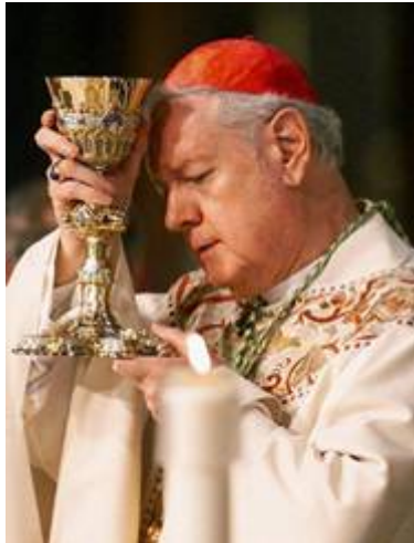
Izquierda. Arzobispo Egan, de Nueva York, EEUU, con un cáliz de exquisita hechura, finamente adornada.