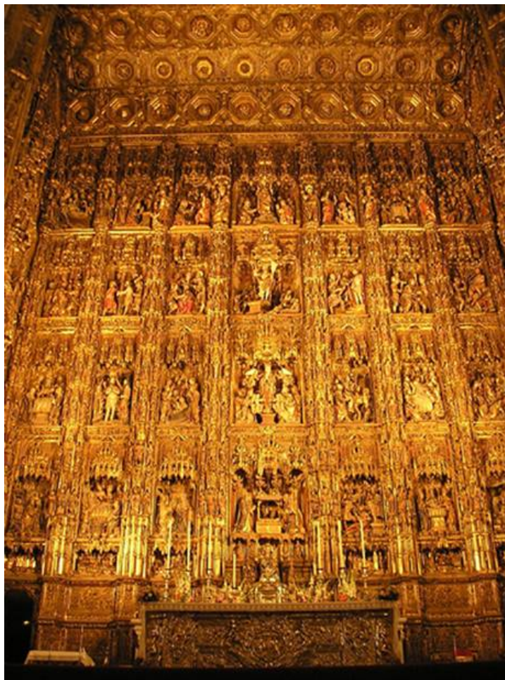
La catedral en Sevilla, España.

La catedral de Sao Francisco, Brasil, contiene ¡una tonelada de oro puro! El día 06 de abril de 2012, una onza de oro vale $1,630.05 ( www.goldprice.org ). El valor de una tonelada de oro sería $52,161,600.00.