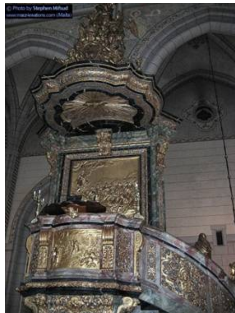
Izquierda. Altar de la catedral de Saint Louis, Missouri, EEUU