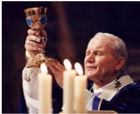
El Papa Juan Pablo, con cáliz de oro y piedras preciosas.