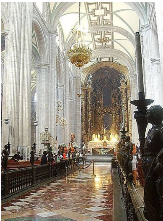
Nave de la Catedral Metropolitana de Ciudad de México