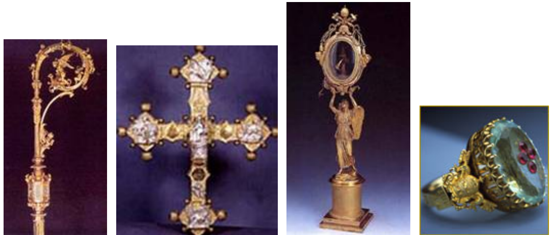
Izquierda a derecha. El cayado ornato del Papa Leo XIII, una cruz de piedras preciosas, el relicario de plata barnizada del Papa Pío V y el anillo del Papa Pío IX.

siendo esta iglesia la que más se adorna. A continuación, presentamos unos pocos ejemplos.