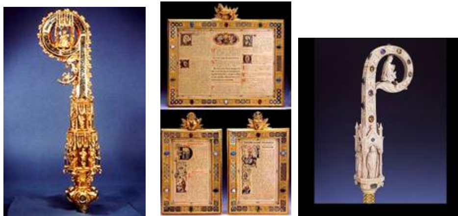
Izquierda. El crosier del obispo Fox. Siglo XVI.