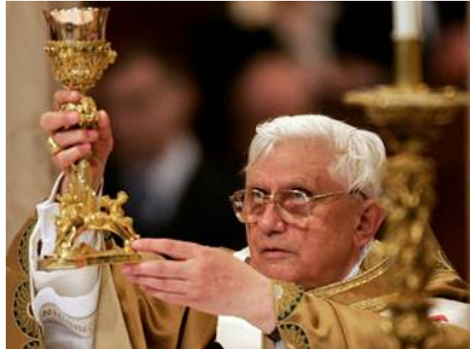
Derecha. El Papa Benedicto XVI con un cáliz muy ornato de oro y piedras preciosas. Año 2005.