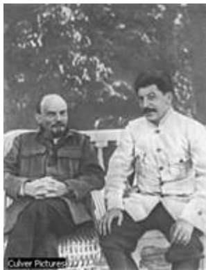
Vladimir Illyich Lenin y Joseph Stalin

"La religión es el opio del pueblo" es una cita de Karl Marx, frecuentemente repetida por partidarios y opositores del marxismo. La expresión es la traducción del alemán "Die Religion ... Sie ist das Opium des Volkes" . Esta cita proviene de su obra Contribución a la Crítica de la Filosofía del Derecho de Hegel 1 (1943: Kritik des hegelschen Staatsrecchts ) publicada en 1844 en el periódico Deutsch-Französischen Jahrbücher , que Marx editaba junto con Arnold Ruge. Allí se lee: 'La inquietud religiosa es al mismo tiempo la expresión del sufrimiento real y una protesta contra el sufrimiento real. La religión es la queja de la criatura oprimida, el sentimiento de un mundo sin corazón y el espíritu de un estado desalmado de cosas. Es el opio del pueblo.' ( www.wikipedia.org Artículo "Opio del pueblo")