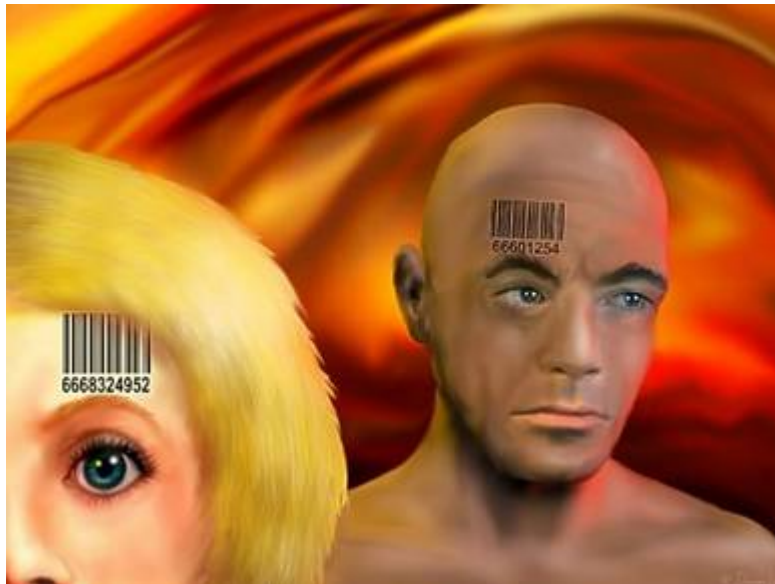
La “marca”: ¿el “Código Universal de Productos”? Pintura por Duncan Long.