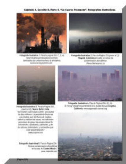
Fotografía ilustrativa 1. Una industria química lanza enormes cantidades de contaminantes a la atmósfera.

a) La contaminación atmosférica que resulta del humo y los gases lanzados por un sinnúmero de fábricas, talleres, refinerías, petroquímicas, plantas de energía eléctrica, etcétera, etcétera, la cual literalmente opaca en parte (" la tercera parte ") la luz que emiten el sol, la luna y las estrellas.