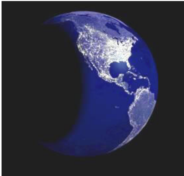
El hemisferio occidental de noche. www.thomashouk.com