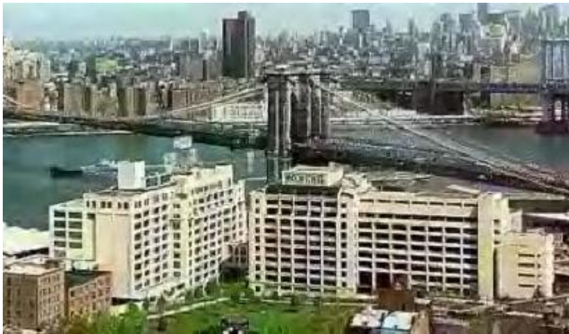
Cuartel general de los testigos de Jehová en Brooklyn, Nueva York.