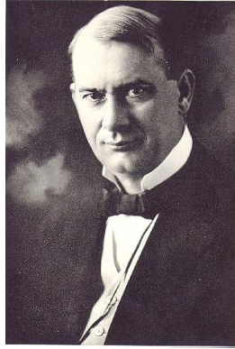
Joseph Franklin Rutherford, tercer presidente de la Torre de Vigilancia. c. 1910. Conocido como "Juez Rutherford". www.wikipedia.org