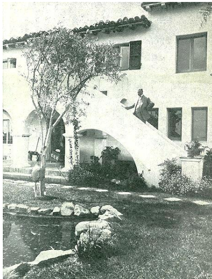
Beth Sarim, San Diego, California.

nunca morirían? Pues, ¡ya han muerto! Estamos viviendo el año 2017. Aquella generación del año 1918, efectivamente, ha pasado ya a la historia, quizás con raras excepciones. De cierto, a los testigos se les acabó el tiempo.